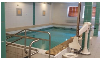
Kauppakatu 58 -60

Altaat ovat terapia – altaita, jotka soveltuvat sekä yksilö- että ryhmäohjaukseen. Veden lämpötila on n 30`tta. Syvimmillään altaat ovat 140cm. Kaikilla altailla on allashissi. Urheilukatu 5:ssä on myös kylmäallas.