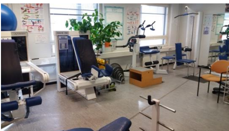
Taikinamäen kuntokammari, Urheilukatu 5 Hallituskatu 58 - 60

Kuntokammarit sijaitsevat Lauritsalassa ja keskustassa Taikinamäellä. Ne on suunniteltu ikäihmisten tarpeet huomioiden. Kuntokammarit sijaitsevat katutasossa. Niihin on helppo tulla myös apuvälineen kanssa.